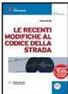
LE RECENTI MODIFICHE AL CODICE DELLA STRADA di Piccioni Fabio – 2006 Editore Experta