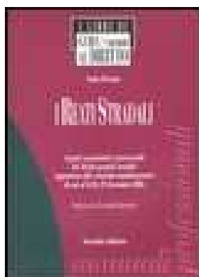
I REATI STRADALI. ASPETTI SOSTANZIALI E PROCESSUALI DEL DIRITTO PENALE STRADALE di Piccioni Fabio – 2007 Editore Il Sole 24ORE Pirola