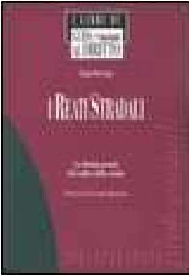
I REATI STRADALI. LA RIFORMA PENALE DEL CODICE DELLA STRADA di Piccioni Fabio – 2004 Editore Il Sole 24ORE Pirola