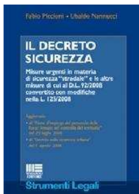
IL DECRETO SICUREZZA di Piccioni Fabio, Nannucci Ubaldo – 2008 Maggioli Editore