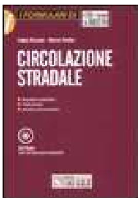
CIRCOLAZIONE STRADALE. CON CD-ROM di Piccioni Fabio, Tomba Marco – 2008 Editore Il Sole 24ORE Pirola