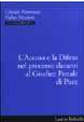
L' ACCUSA E LA DIFESA NEL PROCESSO DAVANTI AL GIUDICE PENALE DI PACE di Piccioni Fabio, Nannucci Ubaldo - 2002 Editore Laurus Robuffo