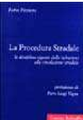
LA PROCEDURA STRADALE. LA DISCIPLINA VIGENTE DELLE INFRAZIONI ALLA CIRCOLAZIONE STRADALE di Piccioni Fabio – 2000 Editore Laurus Robuffo